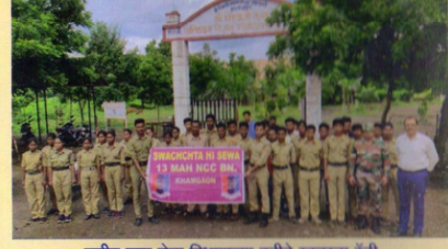
राष्ट्रीय छात्र सेना विभागाच्या वतीने स्वच्छता रॅली