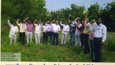
वनस्पतीशास्त्र विभागातर्फे राबविलेल्या सीडबॉल निर्मिती उपक्रमात सहभागी प्राध्यापक, प्राध्यापक व शिक्षकेतर कर्मचारी