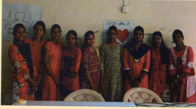
'रक्तदान हेच श्रेष्ठदान' या विषयावर पोस्टर प्रेझेंटेशन मध्ये सहभागी विद्यार्थिनी