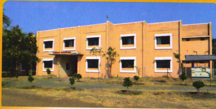
महाविद्यालयाचे महिला वसतीगृह