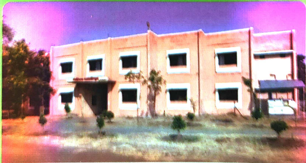
महाविद्यालयाचे महिला वसतीगृह