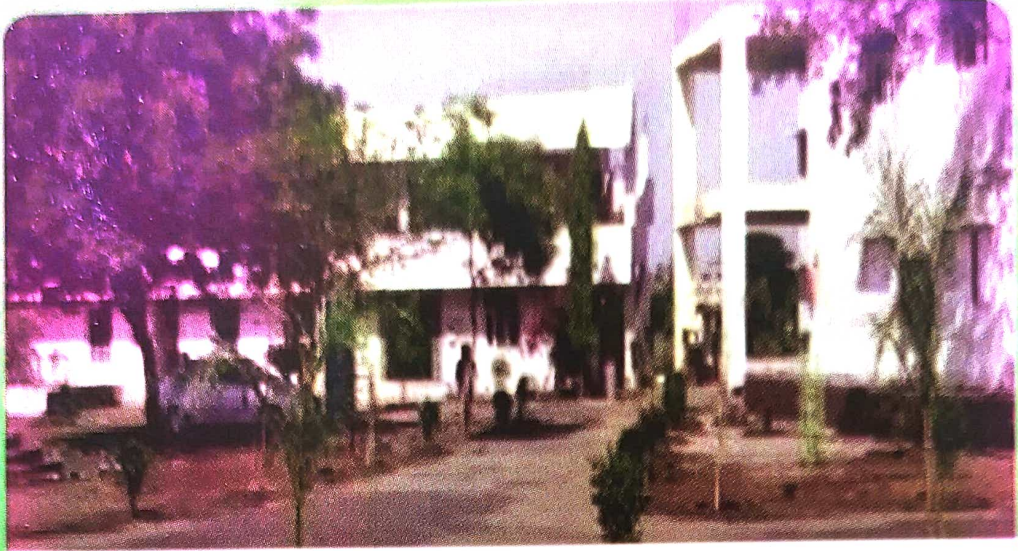
महाविद्यालयाची प्रशासकीय इमारत