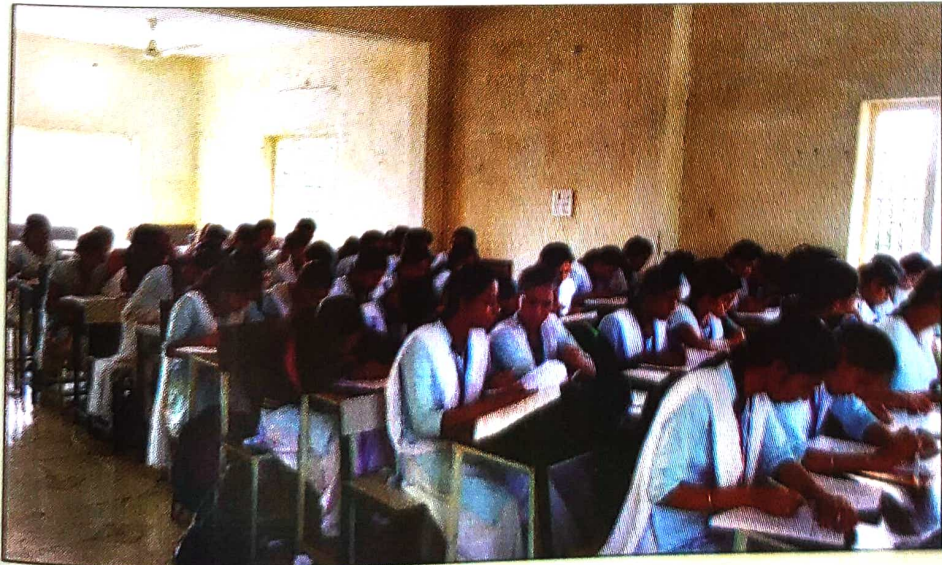
संस्थास्तरीय युवाभूषण स्पर्धेकरिता सहभागी विद्यार्थी